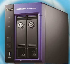
コンパクトサーバー